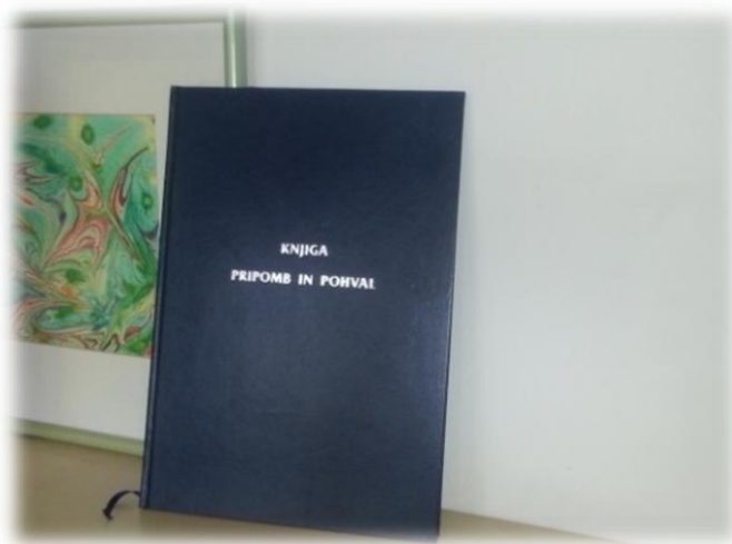
Knjiga pripomb in pohval, Cene Štupar-CILJ

Način spremljanja: Pritožbe in pohvale obravnavamo enkrat na mesec in se nanje tudi ustrezno odzivamo.