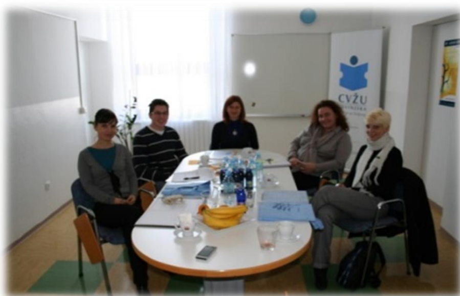
Zgledovalni obisk, UPI Žalec, 2012

Način spremljanja: Zgledovalni obisk izpeljemo enkrat na dve leti oziroma po potrebi.